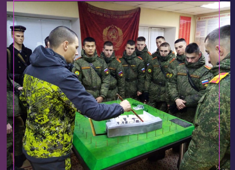
Проект «Памятник воинской славы - Артиллерийский полукапонир Благовещенского укрепленного района» ООО АСМ