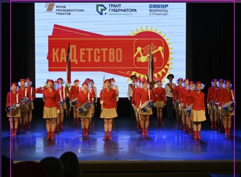
проект «КаДетство» АНО "МОЛОДЕЖНАЯ ОРГАНИЗАЦИЯ ПАТРИОТИЧЕСКОГО ВОСПИТАНИЯ МОЛНИЯ»